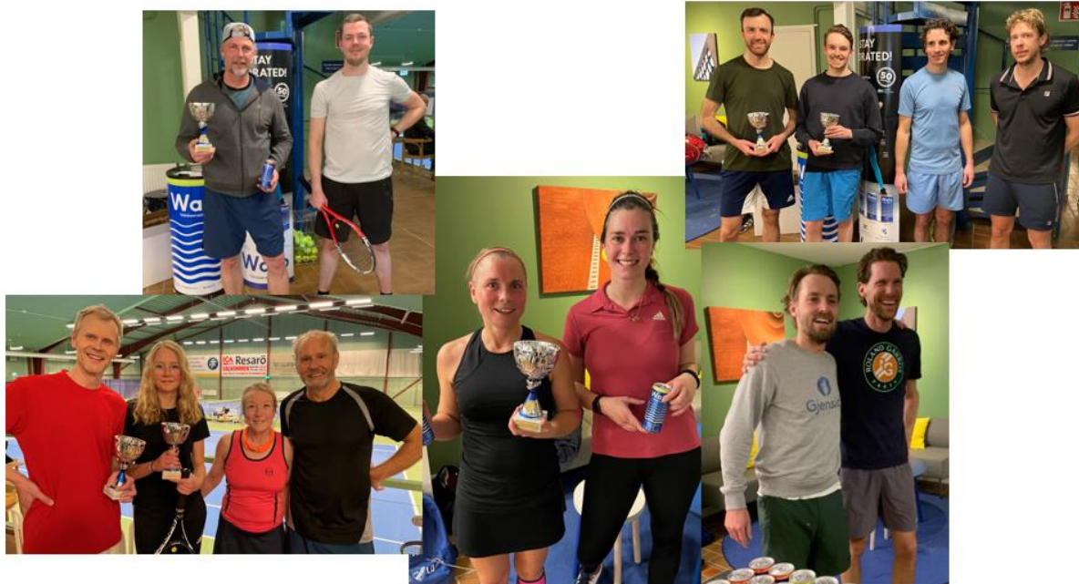
Bild på alla finalisterna i Inne-KM 2022