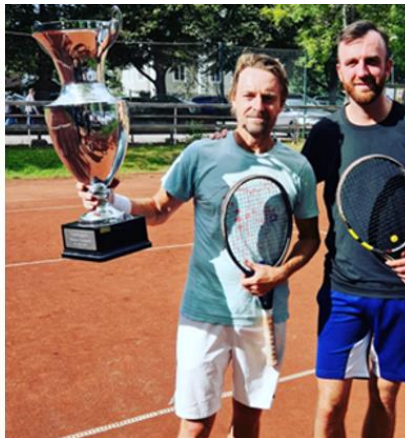
Herrsingel A finalisterna

Nu ser vi fram emot många hungriga deltagare i Inne-KM 2023 som går av stapeln 25 mars till 2 april!