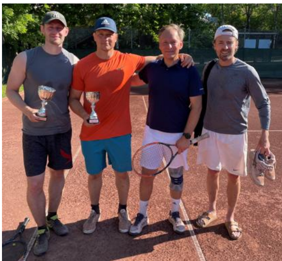
Bilder på några av finalisterna i Ute-KM 2024

Inne-KM 2025 kommer att spelas 15:e till 23:e mars. Anmäl er nu! 😊