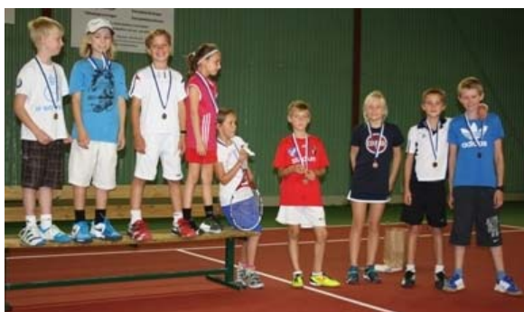
Alla deltagare fick en medalj.

För juniorer så arrangerades Junior Panattan lördagen den 22 september. Det blev en succé i år igen och 10 ungdomar var med. Totalt spelades 10 dubbelmatcher, rundtennis och alla var med på en frågesport. Till middag bjöds på pizza och till efterrätt blev det kaka med glass.